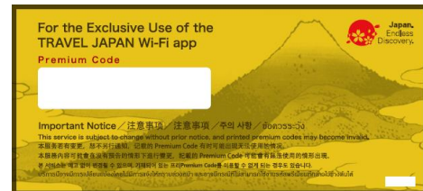
図 3 : TRAVEL JAPAN Wi-Fi プレミアムコード