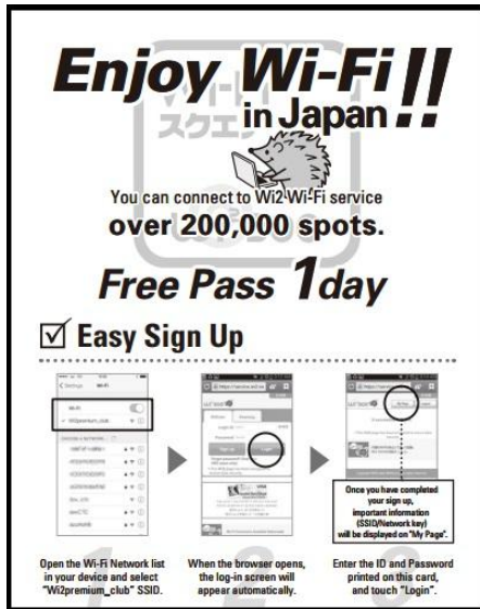
図 1 : ワンタイムチケット イメージ